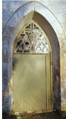
Haupttür der Kirche

In Pilistvere müssen zwei Türen der Kirche aus dem 13. Jahrhundert, die ein Kulturdenkmal ist, restauriert werden. Sie sind morsch und lassen Wind und Kälte durch. Trotz ihres schlechten Zustandes zeugen sie von der langen Geschichte der Kirche und haben einen künstlerischen Wert, so dass eine Meisterwerkstatt mit der Restaurierung beauftragt werden muss. Erforderliche Summe: 5.000 Euro.