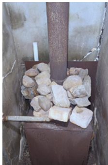
Ofen im Pastorat

In Pilistvere müssen zwei Türen der Kirche aus dem 13. Jahrhundert, die ein Kulturdenkmal ist, restauriert werden. Sie sind morsch und lassen Wind und Kälte durch. Trotz ihres schlechten Zustandes zeugen sie von der langen Geschichte der Kirche und haben einen künstlerischen Wert, so dass eine Meisterwerkstatt mit der Restaurierung beauftragt werden muss. Erforderliche Summe: 5.000 Euro.