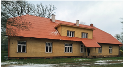
Pastorat in Puhja