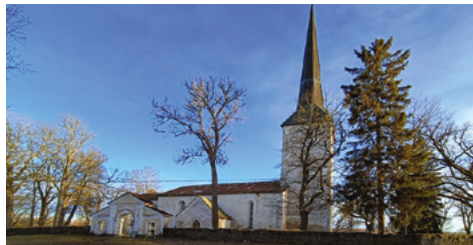
Kirche Pilistvere Estland

Die Kirchengemeinde Puhja benutzt ihr Pfarrhaus auch für Gemeindeveranstaltungen, z.B. für Kindergottesdienste und einen Jugendtreff. Die meisten Öfen im Pfarrhaus funktionieren nicht, so dass die Räume im Winter derzeit nicht genutzt werden können und die Veranstaltungen im Wohnzimmer der Pfarrfamilie stattfinden oder ausfallen müssen. Brennholz gibt es genug, aber die Öfen müssen wieder instandgesetzt werden, damit sie energiesparend heizen und den Anforderungen der Umweltauflagen entsprechen. Erforderliche Summe: 5.000 Euro.