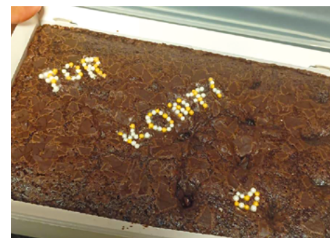
Die 45-Minuten-Wette haben die Konfis gewonnen, daher gab es beim letzten Konfi-Treffen vor den Herbstferien Kuchen von den Teamern!

Nach den Weihnachtsferien gibt es außer den Mittwochstreffen noch verschiedene Events bis zur Konfirmation im Mai. So steht ein Besuch beim Orgelbauer Jäger & Brommer an, der Gottesdienst der Konfirmand*innen am 1. Februar, den sie selbst vorbereiten, und natürlich das Highlight: das Konfi-Wochenende in Wolfach Ende Februar.